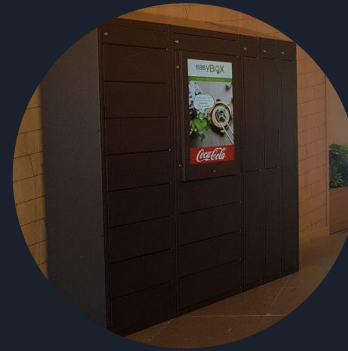
Click & Relax easyBOX