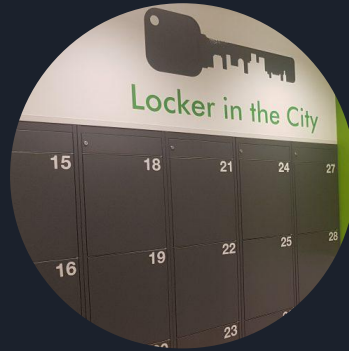
Custodia de maletas