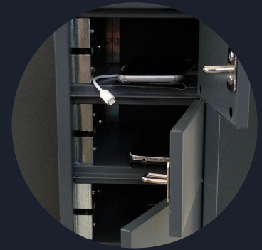
Carga de móviles