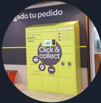
Click & Collect

Consignas inteligentes para todo tipo de usos.